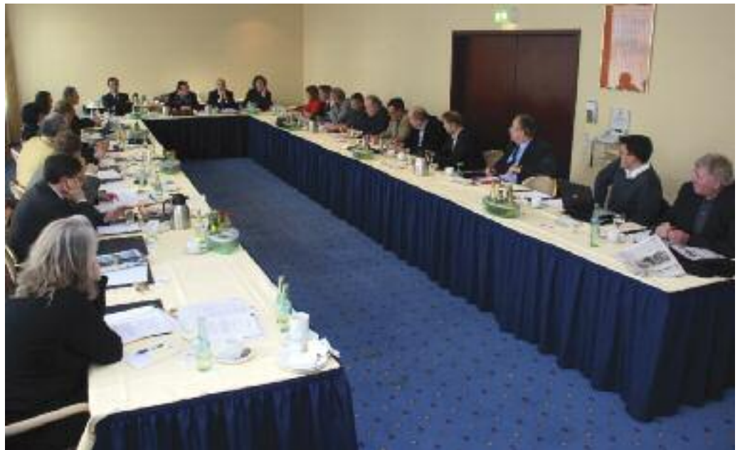
Die Verhandlungskommission bei ihrer gestrigen Beratung

Wenn Kurzarbeit nicht mehr möglich ist, kann als letzte Alternative die Arbeitszeit mit einem Teilentgeltausgleich abgesenkt werden. Die Untergrenze dafür liegt bei 26 Stunden pro Woche. Die Beschäftigten arbeiten in diesem Fall 26 Stunden