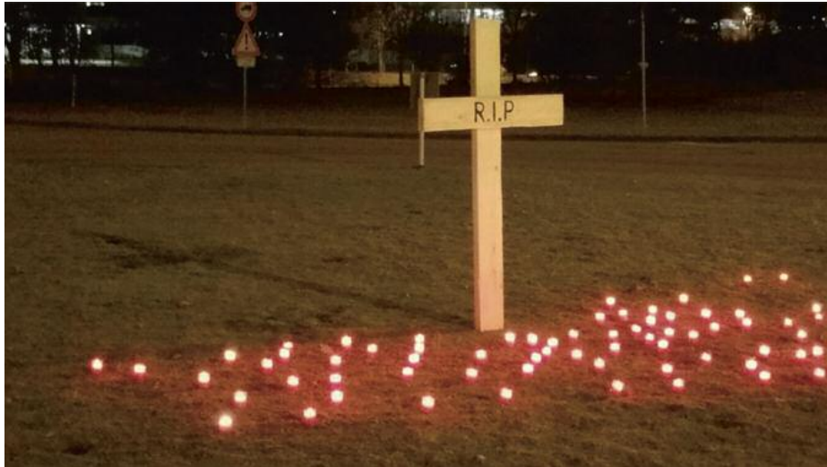
Ein starkes Zeichen der Solidarität mit den Leiharbeitnehmern durch die VKL

Das nennt sich „Equal Treatment“, was kompromisslos gleiche Bezahlung, inklusive Urlaubs- und Weihnachtsgeld und die Auszahlung der Ergebnisbeteiligung bedeutet.