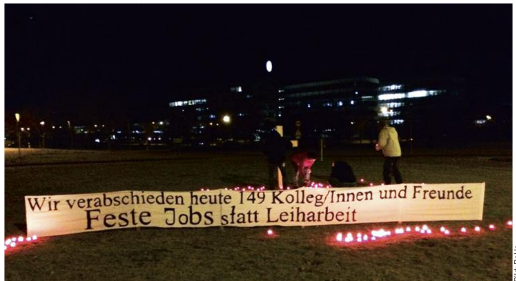
Die Solidaritätskundgebung war weithin sichtbar und hat einen starken Eindruck hinterlassen

Außerdem stehen wir für die Übernahme aller Leiharbeiter in ein festes Arbeitsverhältnis nach einem klar definierten Zeitraum.