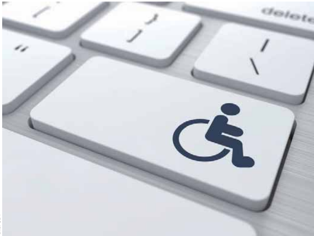
Menschen mit Behinderung sind besonders betroffen, wenn die extra ausgewiesenen Parkplätze von rücksichtslosen und egoistischen Kolleginnen oder Kollegen zugeparkt werden

Ein Shuttleservice vom Bahnhof ins Werk könnte ebenfalls helfen, die Parksituation zu entspannen. Vor knapp einem Jahr wurde zugesagt, bis 2020 eine Milliarde Euro in das Werk Würth zu investieren. Wäre es da nicht Sinnvoll, wenn man davon etwas für den Bau von weiteren Mitarbeiterparkplätzen ausgeben würde?